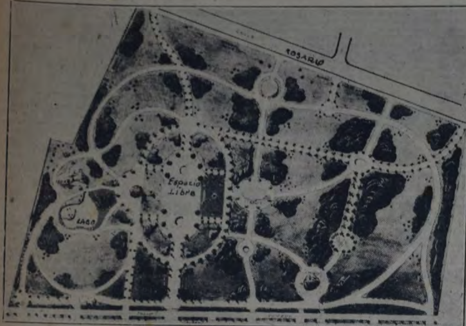
PROYECTO DE TRAZADO EN LA EX QUINTA LEZICA, APROVECHANDO LAS PLANTACIONES EXISTENTES.