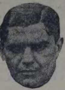
que dirigirá hoy la línea de ataque del combinado de la zona Sud en su cotejo con el de la zona Norte.

asistir al partido que será entre dos combinados de las zonas Sud y Norte. El encuentro será dirigido por los referentes Cúneo y Repost, un período cada uno.