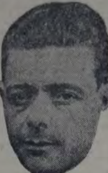
Punto fuerte de la defensa del cuadro de la zona Norte, en el partido de hoy en la cancha de River Plate.